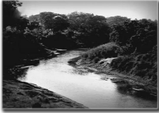
แม่น้ำหิรัญวดี

[๑๒๘] ครั้งนั้น พระผู้มีพระภาคสั่งกะท่านพระอานนท์ว่า ดูกรอานนท์ มาไปกันเถิด เราจักไปยังฝั่งโน้นแห่งแม่น้ำหิรัญวดี เมืองกุสินารา และสาละวัน อันเป็นที่แหวะพักแห่งพวกเจ้ามัลละ