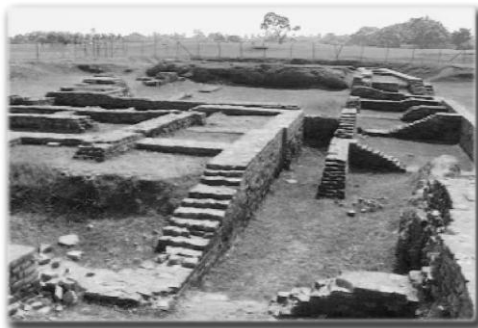
ส่วนหนึ่งของบริเวณวังเจ้าลิจจวี

ลำดับนั้น พวกเจ้าลิจจวี ประทับมือว่า นางอัมพปาลีศณิกาขณะ พวกเราแล้วหนอ พวกเราถูกนางอัมพปาลีศณิกาลงแล้วหนอ พวกเจ้าลิจ จวีขึ้นชมยินดีภักษิตของพระผู้มีพระภาคแล้วลุกจากอาสนะ ถวายบังคม พระผู้มีพระภาค กระทำประทักษิณหลีกไปแล้ว ฯ