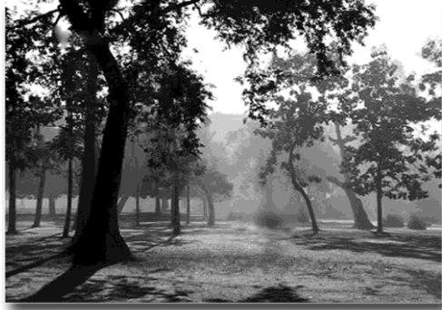
สวนป่าสาละ ณ เมืองกุสินารา