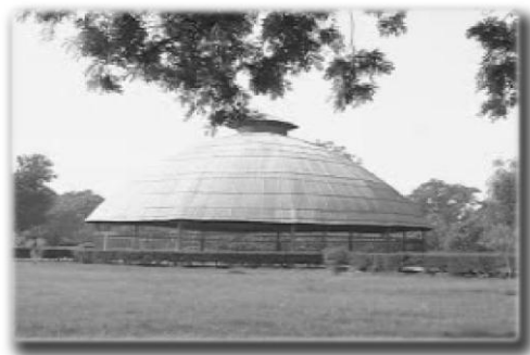
พระธาตุเจดีย์แห่งเมืองเวสาลี

ดูกรภิกษุทั้งหลาย ภิกษุควรเป็นผู้มีสติสัมปชัญญะอยู่ นี้เป็น อนุศาสน์ของเรา สำหรับเธอ ฯ