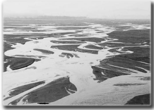
แม่น้ำเนรัญชรา

นิโครทแทบฝั่งแม่น้ำเนรัญชรา ในอุรุเวลาประเทศ ครั้งนั้น มารผู้มีบาปได้ เข้าไปหาเราถึงที่อยู่ ครั้นเข้าไปหาแล้วยืนอยู่ ณ ที่ควรส่วนข้างหนึ่ง ครั้น มารผู้มีบาปยื่นเรียบบร้อยแล้วได้กล่าวกะเราว่า